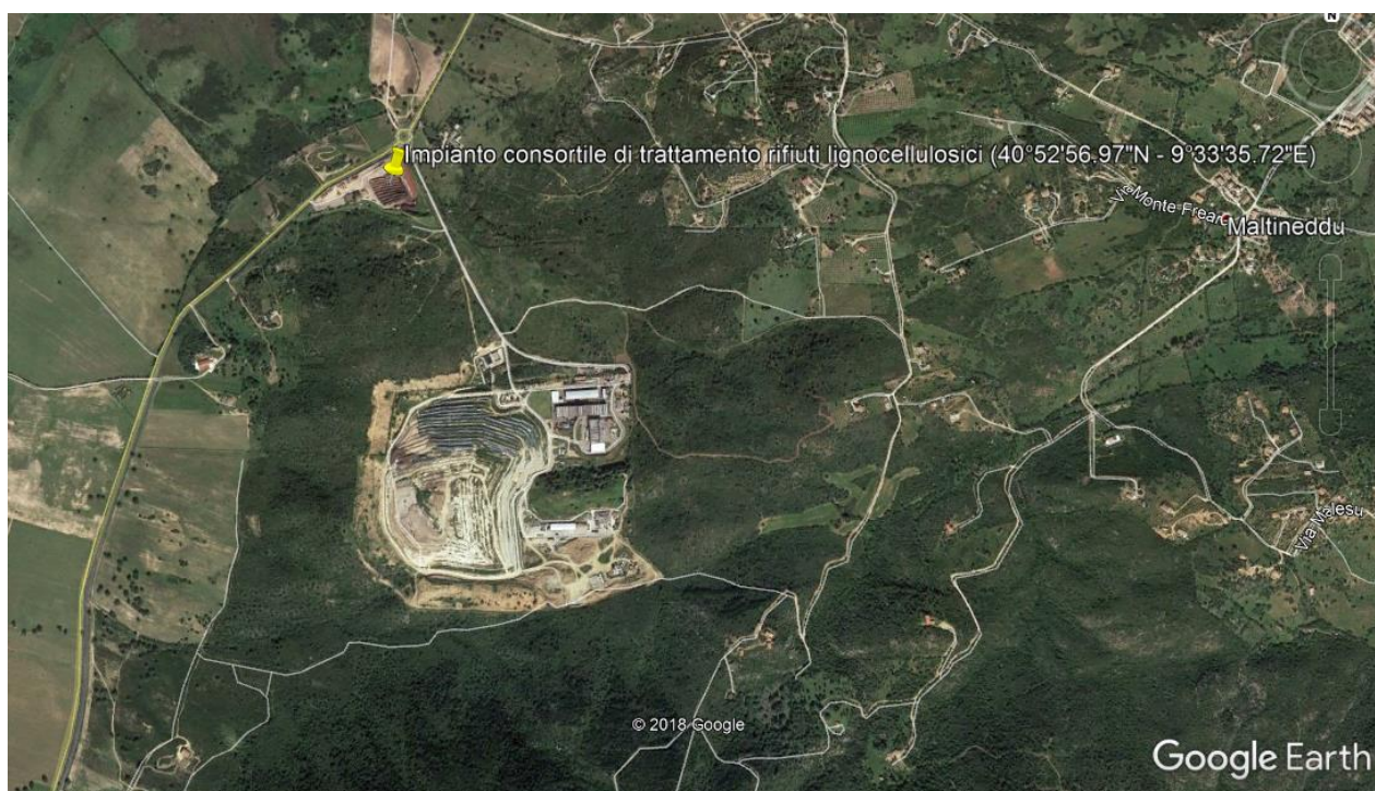
Figura 1: Ubicazione impianto

L'impianto in questione è ubicato in Loc Spiritu Santu nel Comune di Olbia, come individuabile dal seguente stralcio dell'immagine satellitare (fonte: Google Earth):